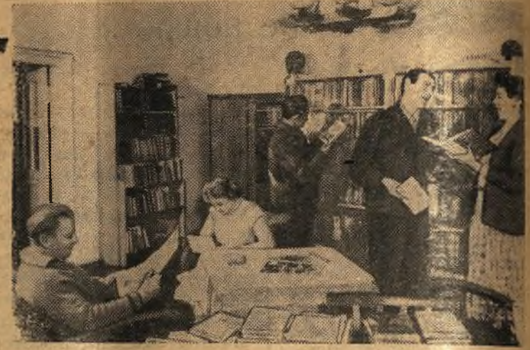
Германская Демократическая Республика. В библиотеке Дома культуры в деревне Круге, район Бад Фрейенвальде.