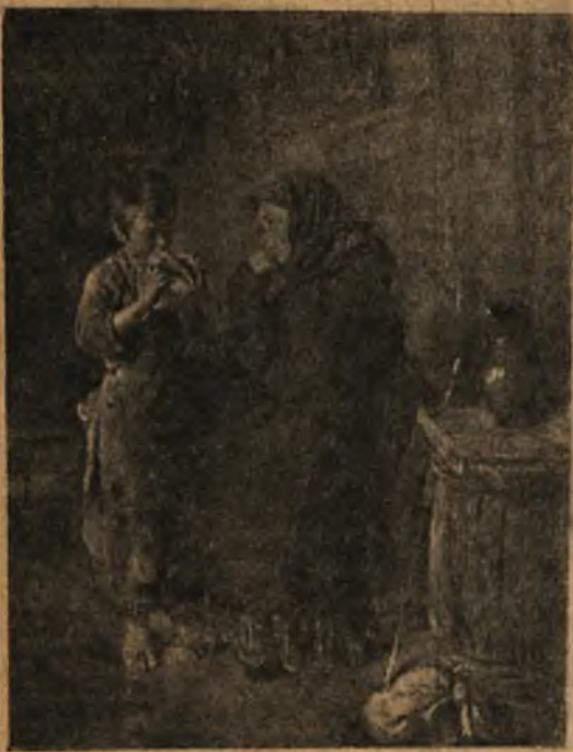
В. М. Васнецов. «На побывку к сыну»

Как бывает вознагражден зритель, когда он вдумается в работу художника, поймет его оригинальные черты, замысел.