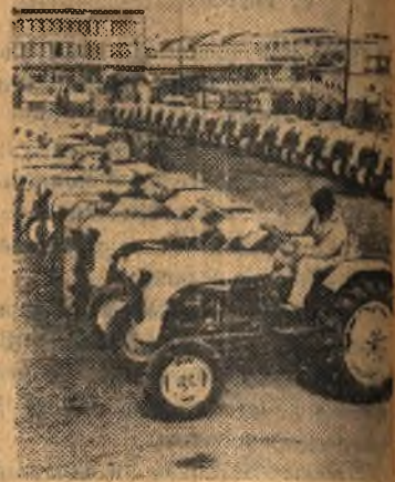
Польская Народная Республика. Тракторы марки «Урсус С-325» во дворе предприятия «Урсус».