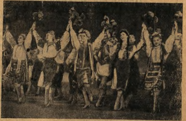
МОСКВА. 12 ноября в день открытия декады в помещении Концертного зала имени П. И. Чайковского состоялся концерт Государственного заслуженного ансамбля танца УССР. Художественный руководитель — народный артист УССР Павел Вирский.

На снимке: ансамбль исполняет хореографическую картину «Красная калина».