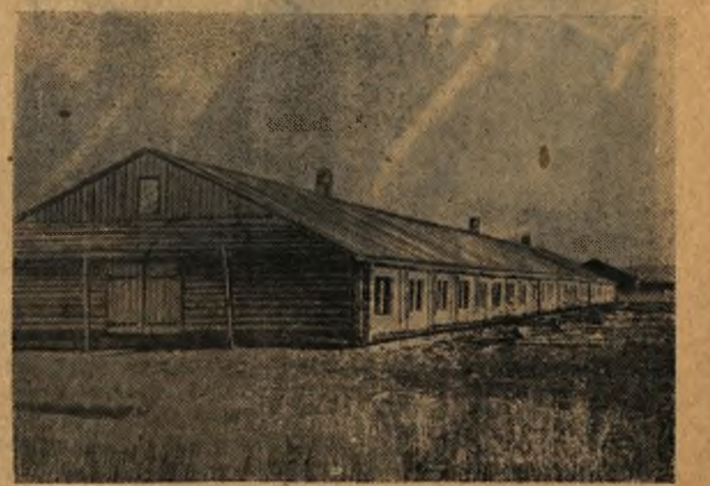
На снимке вы видите основное здание Бардымской птицефабрики колхоза им. Ленина.