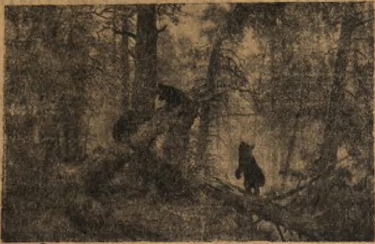
И. И. Шишкин. «Утро в сосновом лесу»

Для того, чтобы в полной мере понять и почувствовать мысли и переживания, которые вложил художник в картину, нужно быть чутким и выразительным к особенностям ее колорита, пространственного построения и т. д., видеть связь между мастерством исполнения картины и ее замысла.