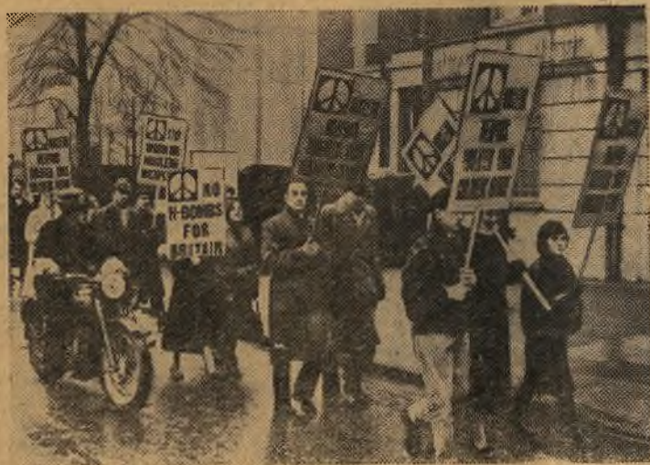
Лондон. Демонстрация протеста против производства ядерного оружия.

Демонстранты несут плакаты «Англии не нужны водородные бомбы», «Ядерное оружие угрожает будущему ваших детей».