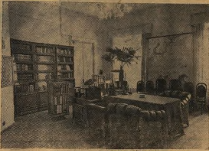
Москва. Кремль. Рабочий кабинет В. И. Ленина.

Чтобы удобно было разговаривать с посетителями, к письменному столу приставлены были другой стол, покрытый красным сукном, и четыре мягких кожаных кресла. Сам Ильич не любил мягкой мебели и