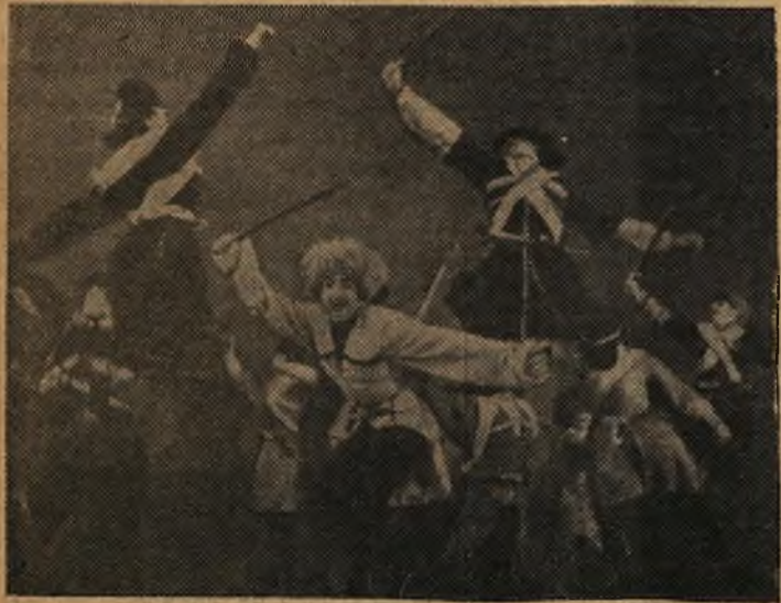
Дагестанская АССР. В Москве будет проходить декада Дагестанского искусства и литературы. В республике идет деятельная подготовка к показу многонационального искусства «страны гор».