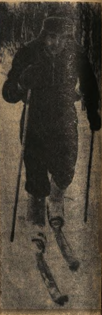
Хорошо зимой на лыжах!

— Не думайте, что только мы накупили себе новой мебели, — весело сказала жена Ставрева. — Теперь все крестьяне зажили по-городскому.