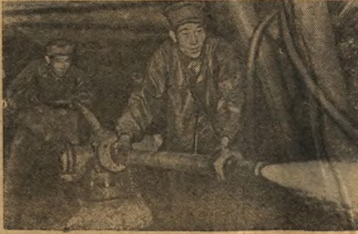
Корейская Народно-Демократическая Республика. На шахте Хенвон в провинции Южный Пхенан добыча угля осуществляется с помощью гидромониторов.

□ ПАРИЖ. Президент Франции генерал де Голль прилетел в город Константина (Алжир) Де Голль пробудет в городе три дня и посетит Республику во время военных действий.