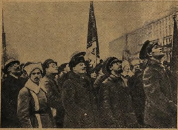
В. И. Ленин и Я. М. Свердлов на площади Революции в Москве (1918 г.).