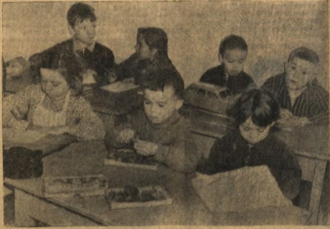
Хорошо живется малышам в детском садике села Барды. Здесь они учатся петь, плясать, лепить из пластилина различные фигурки. На снимке: дети во время занятий.

Факты полностью подтвердились. Проведено комсомольское собрание и группоргу даны соответствующие указания.