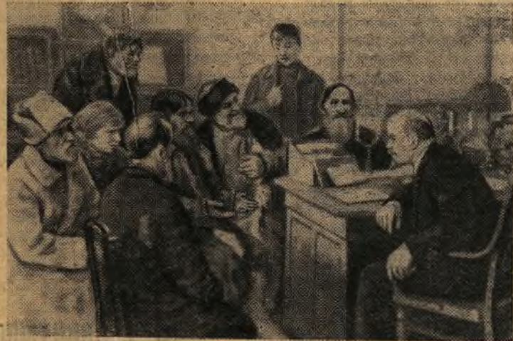
В. И. Ленин беседует с крестьянами. (С картины худ. М. Соколова)