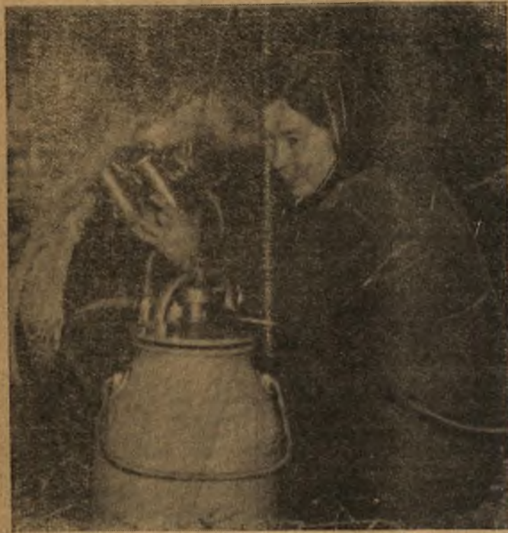
Внедрение механической дойки на Красноярской ферме значительно подняло производительность труда доярок.