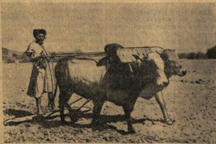
В Йемене подавляющая часть населения страны занимается земледелием и скотоводством. Обработка земли ведется самыми примитивными орудиями.