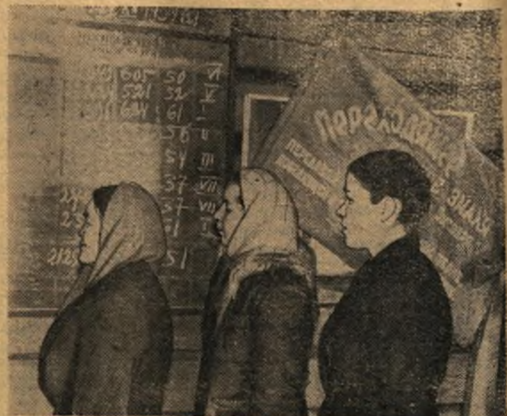
Члены бригады коммунистического труда Мостовинской молочноговарной фермы у Доски показателей.