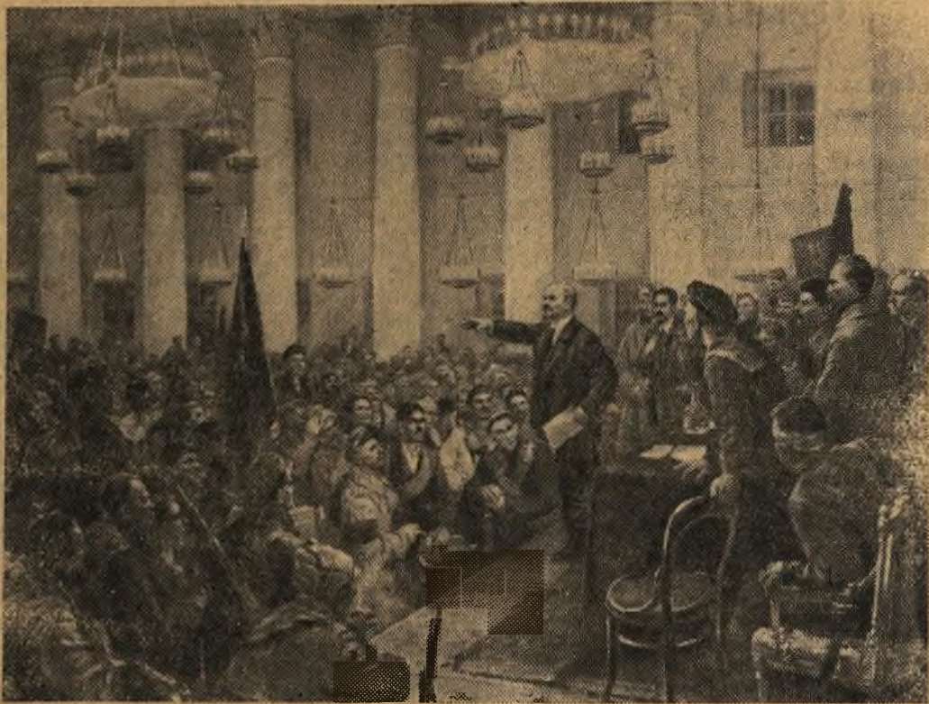
„Выступление В. И. Ленина на II Всероссийском съезде Советов“ Картина художника В. Серова.

Иракской Республики советская промышленная выставка проводится впервые. Ее посетители смогут познакомиться с огромным техническим прогрессом, достигнутым в СССР в различных отраслях индустрии. Свою продукцию в Багдаде покажут заводы Москвы, Ленинграда, Киева, Риги и других городов. (ТАСС).