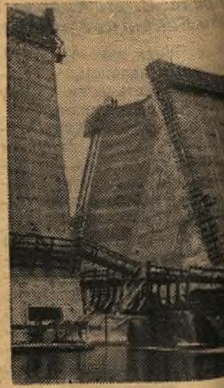
Чехословацкая Республика. Строительство Флайской плотины. Она будет состоять из 35 блоков. Ее высота достигнет 500 метров.

□ ПРАГА. Закончилось первое международное совещание работников театра Советского Союза, Польши, Венгрии, Румынии, Болгарии и Чехословакии. Участники совещания обсудили план сотрудничества на текущий год.