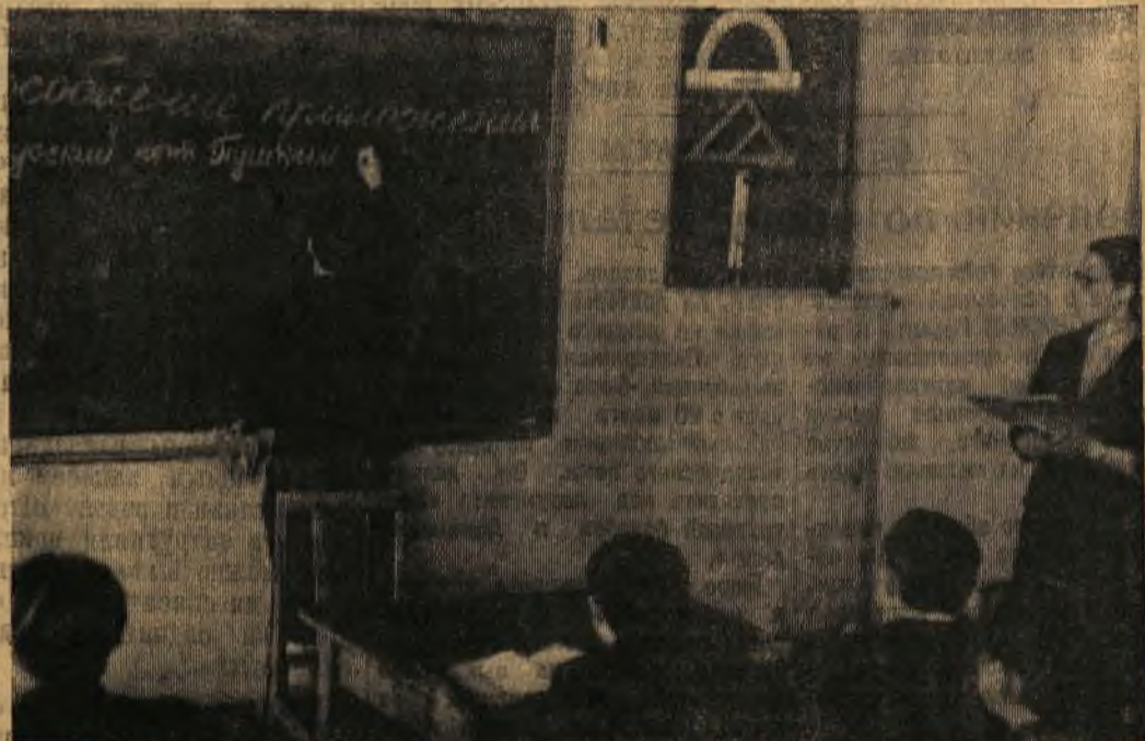
Идет урок русского языка в 7 классе Бардымской средней школы