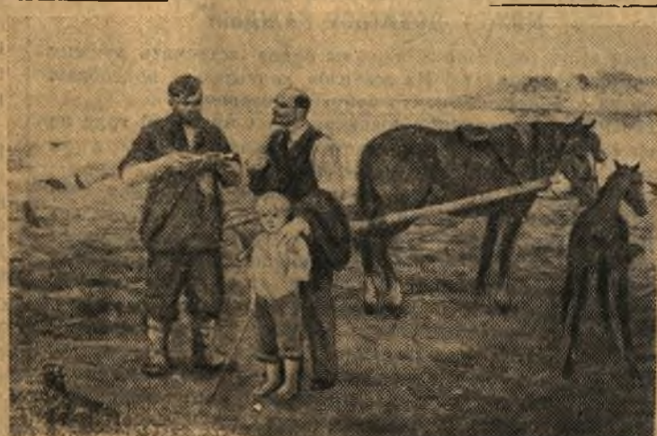
„Разговор о земле“. Картина художника П. Ф. Судакова.

Сюда приходят экскурсанты — студенты, школьники, рабочие, служащие, ученые, немало приезжих. На языках народов Советского Союза и зарубежных стран посетители оставляют в книгах волнующие записи. Много мыслей и чувств рождает посещение университета, где Ленин начинал великий путь революционной борьбы.