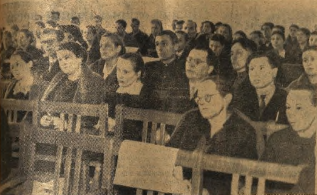
На снимке: В зале заседания учительской конференции.