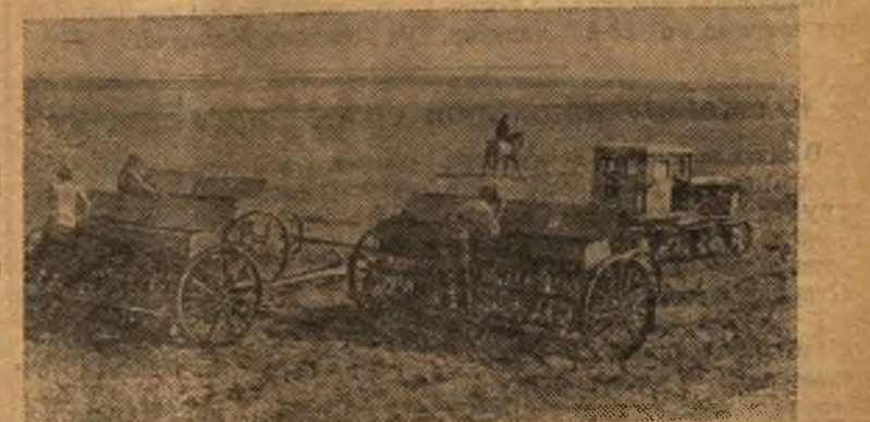
Узбекская ССР. Сев яровых культур в совхозе имени К. Маркса Сурхан-Дарьинской области.