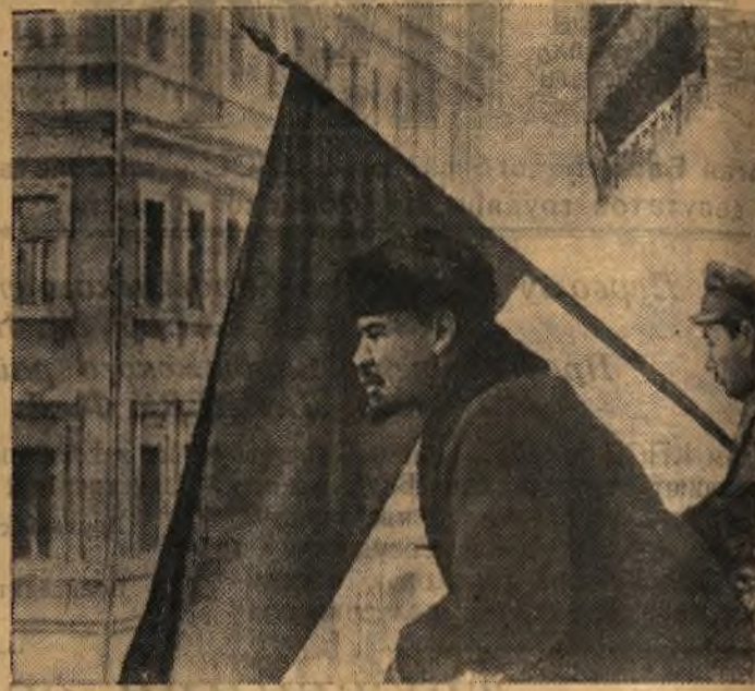
В. И. Ленин выступает с балкона Моссовета с приветствием перед бойцами-коммунистами, отправляющимися на борьбу с Лениным.

Москва, 16 октября 1919 года (кинокадр).