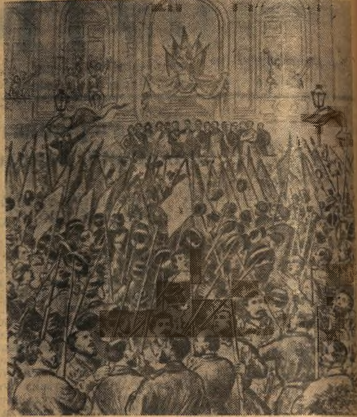
(Иллюстрация из журнала 70-х годов XIX века).