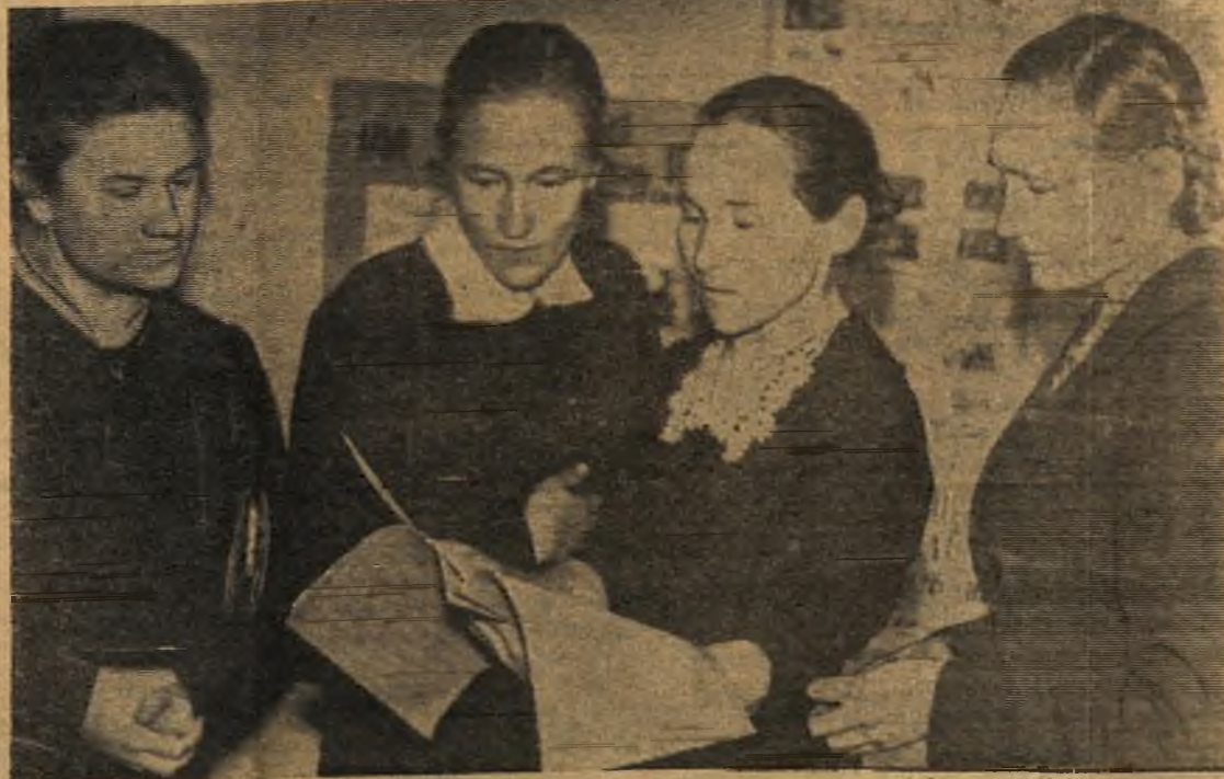
На снимке: группа учителей Коми-Пермяцкого национального округа во время перерыва.