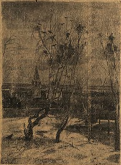
А. К. Саврасов. «Грачи прилетели».

Газета «Мунка» указывает, что народы добьются благородной и желанной цели — защитят мир, если они объединят свои усилия и будут последовательно и активно бороться за мир и дружбу между народами.