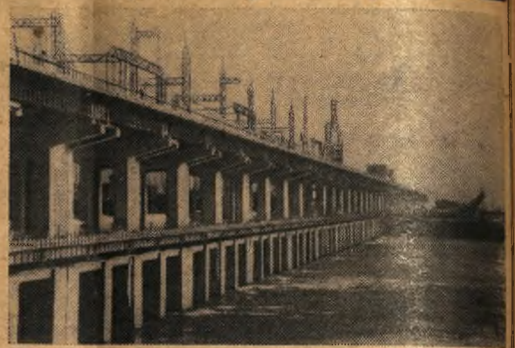
Крупнейшая в мире Сталинградская ГЭС. Ее последний 21-й по счету гидроагрегат недавно вступил в строй действующих.