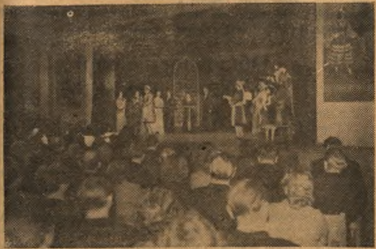
Эстонская ССР. Сельскохозяйственная артель имени Эдуарда Вильде Ракверского района — инициатор республиканского соревнования за высокие показатели в животноводстве. Колхоз достиг уровня производства мяса, запланированного на конец семилетки. Его доход в текущем году составит около 11 миллионов рублей — в полтора раза больше прошлогоднего.

Обсуждение и принятие народнохозяйственного плана и бюджета в Верховном Совете СССР вновь и вновь демонстрируют великую жизненную силу плановой социалистической экономики, ее несравненные преимущества перед экономикой капиталистических стран. Наш план, наш бюджет — это план и бюджет создания, неустанного движения вперед.