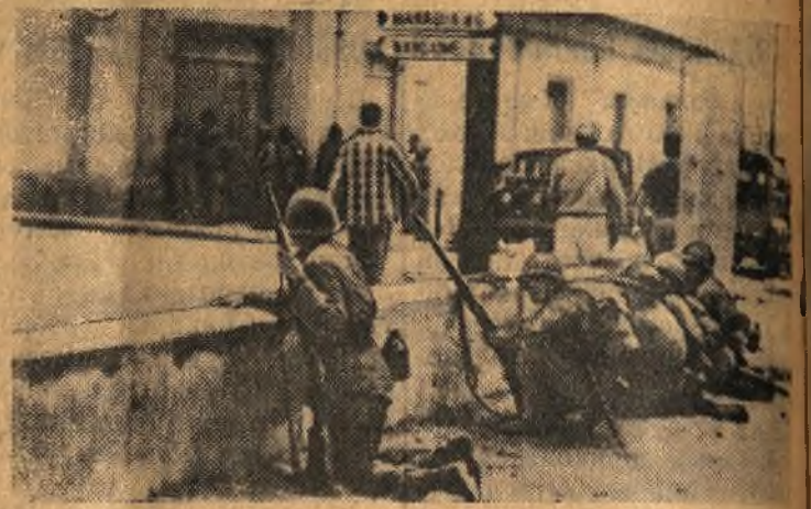
В Никарагуа развернулось движение против диктатора Сомосы. Власти ввели в городах военное положение. Между повстанцами и войсками произошли столкновения. На снимке: солдаты на улицах города Хиногене.