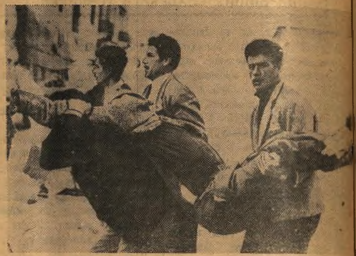
Греция. В начале декабря была проведена всеобщая забастовка афинских строителей. Отряды полиции и жандармерии напали на бастующих с дубинками и пустили в ход бомбы со слезоточивым газом. В районе центральной площади Омонии разыгралось настоящее сражение. Было ранено свыше ста человек.

На снимке: строители уносят раненого товарища.