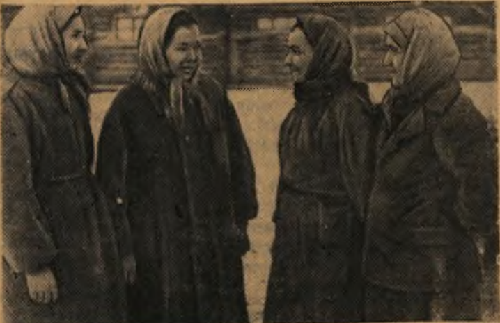
Колхоз им. Ленина выполнил два плана по мясу. В этом значительная доля и чалковских животноводов.