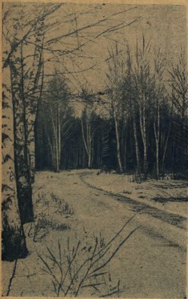
Зима в лесу.