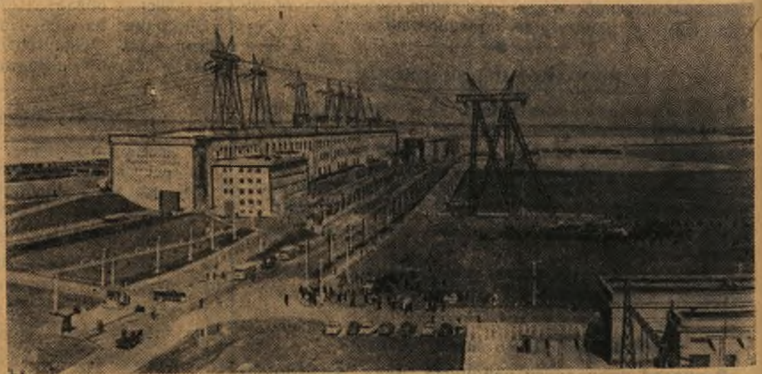
Куйбышевская область. Общий вид Волжской ГЭС имени В. И. Ленина.

«Наша страна достигла такого высокого уровня в развитии экономики, науки и техники, что мы можем приступить и в ближайшие 15—20 лет осуществить выдвинутую великим Лениным задачу сплошной электрификации». (Н. С. ХРУЩЕВ).