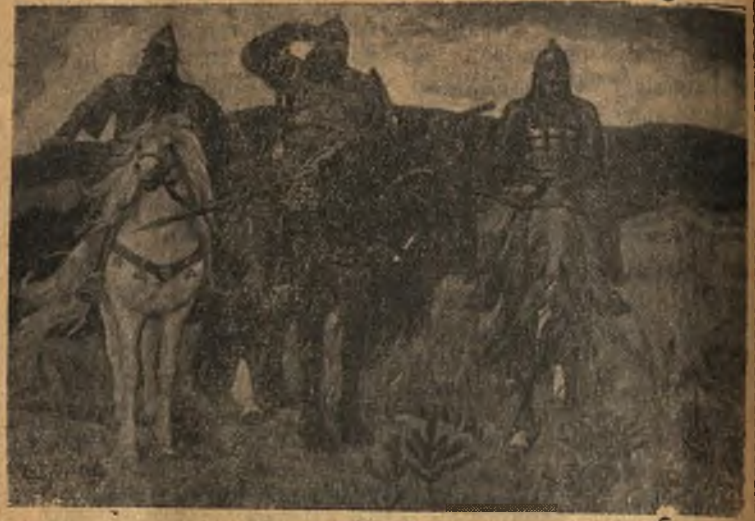
В. Васнецов „Три богатыря“

дистой бородой, в его прямом и твердом взгляде, в позе — во всем чувствуется уверенность в своих силах, готовность уничтожить любого врага. С легкостью держит он висающую на правой руке «палицу булатную сорока пудов», в левой — щит и копье. На богатырской груди кольчуга, голова защищена шлемом, на руках узорчатые рукавицы. Вспомним, как легко победил он у Чернигова силу черную, несметную.