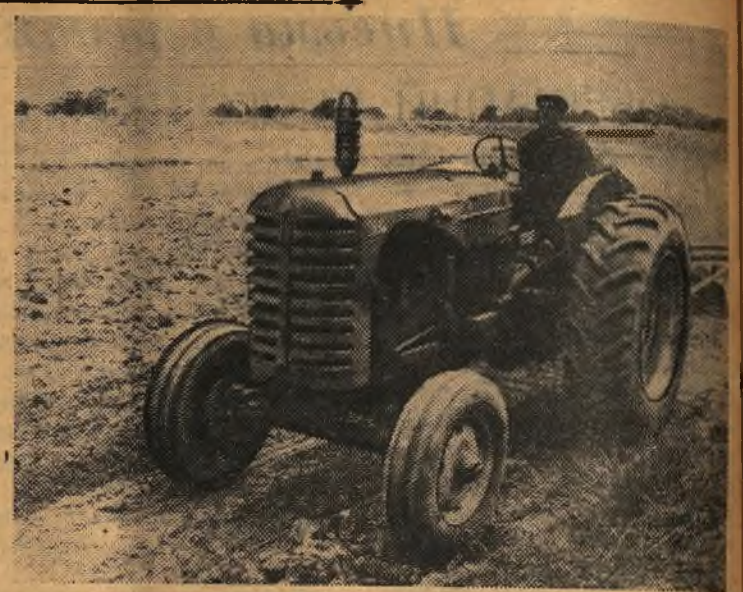
Гvineйская Республика. Вспашка пашей на государственной ферме в окрестностях города Канфан.

На 15 декабря план по району по черному лому выполнен на 64 процента и по цветному — на 50 процентов. Из 16 сдатчиков по черному лому выполнили только два — инкубаторная станция и почта, по цветному из 8 выполнила одна нефтеразведка. Чтобы выполнить годовой план, нужно еще сдать черного лома 190 тонн и цветного 2 тонны. Только Шермейская РТС имеет задолженность по черному лому около 80