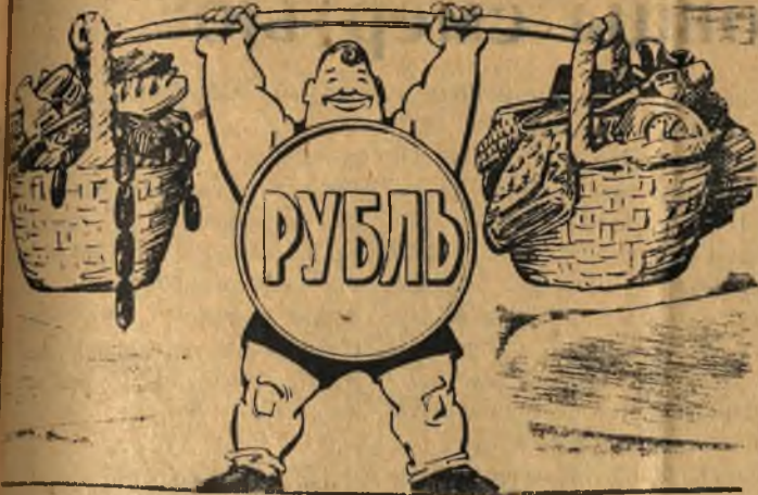
В новой весовой категории.