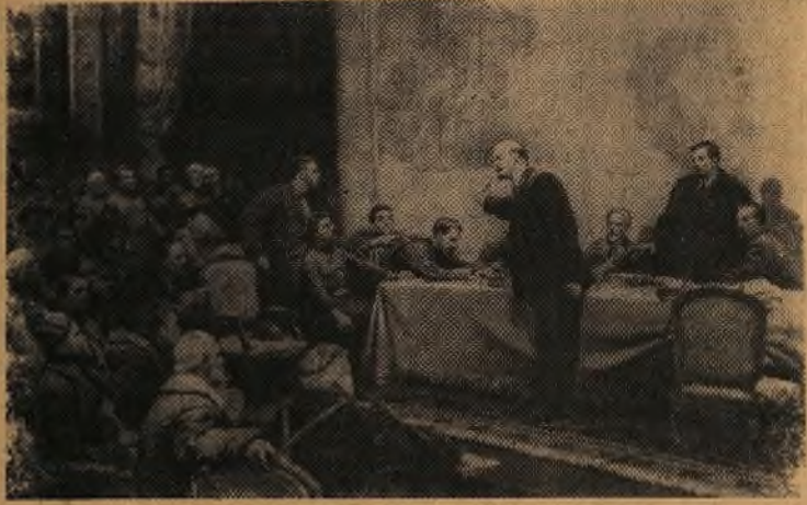
Картина художника Л. А. Шматко «В. И. Ленин у карты ГОЭЛРО» (VIII Всероссийский съезд Советов. Декабрь 1920 года).

Он обосновал грандиозную программу создания экономического фундамента социализма, раскрыл гигантское значение электрификации в строительстве нового общества. Ленинские идеи о создании материально-технической базы социализма, об электрификации страны легли в основу плана ГОЭЛРО — первого перспективного плана развития народного хозяйства.