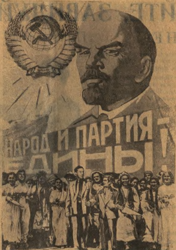
Фотоплакат художника Б. Антонова.

№ 185 (2980) Суббота, 3 декабря 1960 г. Цена 15 коп.